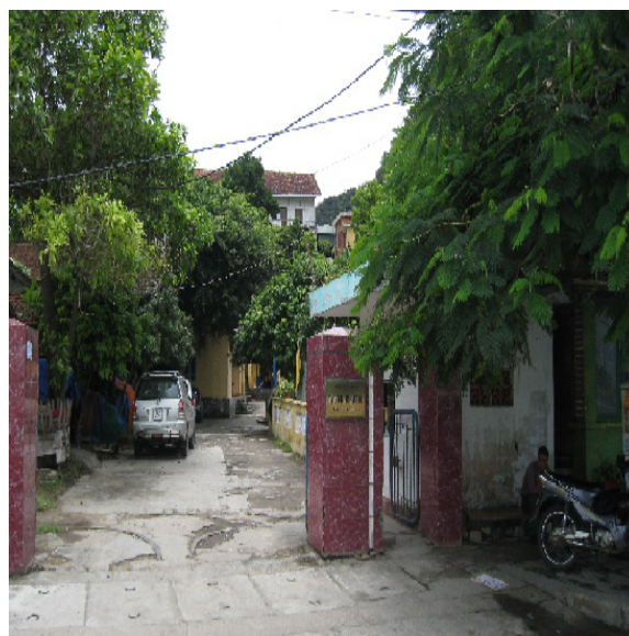
Công ty cổ phần Vận tải Biển và Xuất nhập khẩu Quảng Ninh