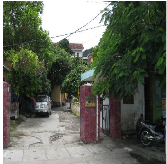
Công ty cổ phần Vận tải Biển và Xuất nhập khẩu Quảng Ninh